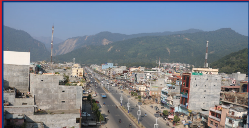
उज्याली सहर बुठवल