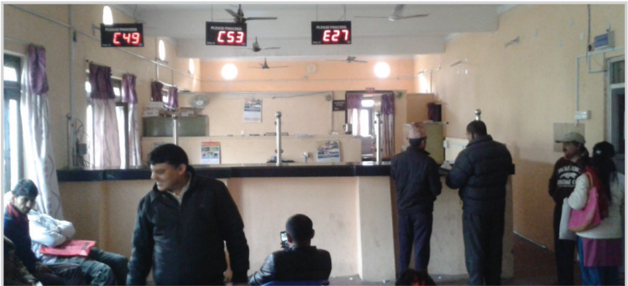
बुटवल उप-महानगरपालिकाको राजस्व असुली काउन्टर